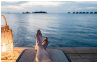
Zeit und Musse finden

Mitgliedverbände der OdA KT und Praktizierende publizieren auf der KT-Webseite regelmässig Artikel, wie KomplementärTherapie ganzheitlich und nachhaltig die Selbstregulationskräfte anregen kann. Hintergrundinformationen sowie praktische Tipps für den Alltag geben Einblick in die 22 verschiedenen Methoden der KomplementärTherapie und laden ein, diese zu entdecken.